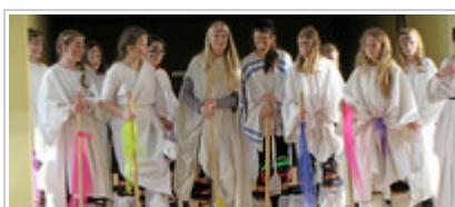
Die Stelzenläufer sorgten bei ...

WETZLAR "Wie können wir Sucht und Gewalt am besten vorbeugen?" - Mit dieser Frage haben sich rund 700 Schülerinnen und Schüler der Freiherr-vom-Stein-Schule in Wetzlar beschäftigt. Ihre Ergebnisse stellten sie beim Tag der offenen Tür vor.